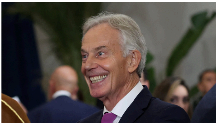
ARCHIEFFOTO: Voormalig Brits premier Tony Blair